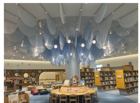
天井からは有明海の波をモチーフにした飾りや船の形の本棚が(子ども用スペース)。

荒尾市には市長直属の「女性シンクタンク」という、係長以下の若い女性で構成され、市の施策を女性や生活者の目線で意見を言う組織があります。この荒尾図書館には、子どもが靴を脱いで本を読んだり寝転がったり、ちょっと遊べるスペースがあります。このすぐ近くに子ども用トイレと授乳室が設置されています。これも女性シンクタンクの助言からできたものでした。当初はこの建物の反対側のトイレを使えばいいと設計されていましたが、子どもは「おしっこ！」と言ってから反対側のトイレまで間に合いませんよね。生活者の視点は施策点検に重要です。